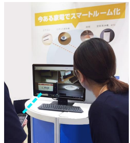
2019年東京会場での様子

イーブロードのネットワーク防犯カメラシステムを使用して、実際に「e-Broad光マンション with IoT」を設置したお部屋をリアルタイム映像でモニタリングします。フェア会場のスマートフォンから、照明やエアコン・TVなどリモコン操作が可能な家電製品の遠隔操作を行っていただき、実際に動いている様子をご体験いただけます。